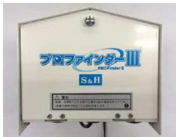
図1. プロファイダー正面写真