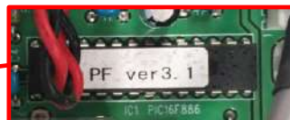
図3. マイコンチップ

プロファイダー正面のふたを開けた中にある、CPU基板上のマイコンチップに記載された数字が CPU ROM version です。