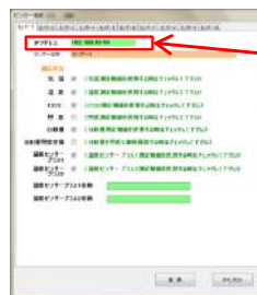
図5. センサー設定画面