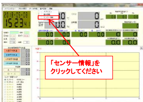
図4. プロファイダー測定画面